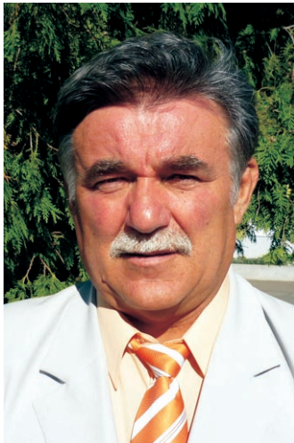
Pál László polgármester

A képviselőtestület döntése alapján újra indítjuk a helyi lapot. Tesszük ezt azzal a reménnyel, hogy a lapban megtaláljuk a helyes arányokat, hisz rólunk szól, nekünk készül.