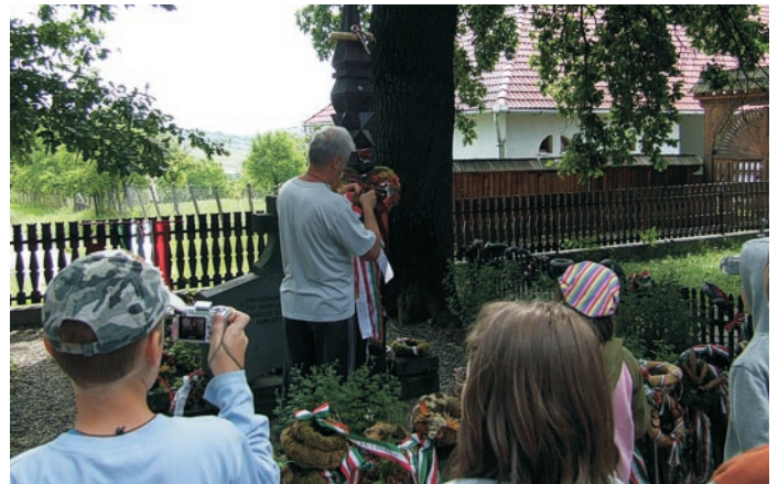
Tamási Áron sírjánál

Mint megtudtuk, a gyulakutai „delegáció” jövő év júliusában látogatja meg itteni testvériskoláját, amelyet a magyar és román gyerekek, valamint azok tanárai már most nagyon várnak.