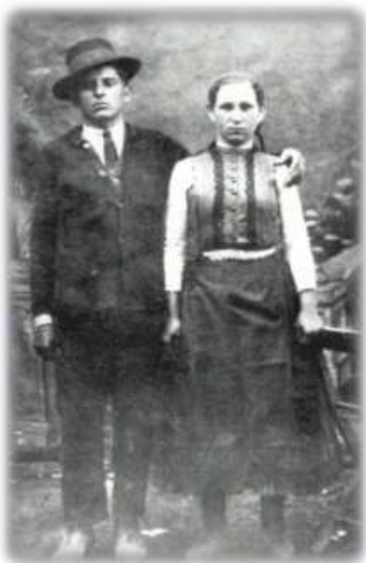
Készült 1920 körül

Korabeli fényképeken mindkét díszítési módra találunk példát.