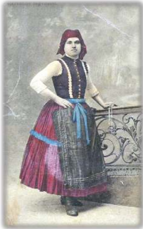
Képeslap kb. 1930-ból

takarja. Anyaga karton, flokon, kékfestő. A felsőszoknyát olykor szalaggal díszítették: a csípő alatti részen körbefutó 3-4 cm széles világos (kék) selyemszalaggal, esetleg az alján, a széltől számítva 5-6 cm magasságban körbefutó általában fekete 1 cm keskeny szalaggal, perklivel.