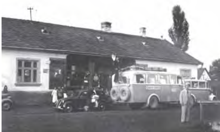
Életkép az 1940-es évekből