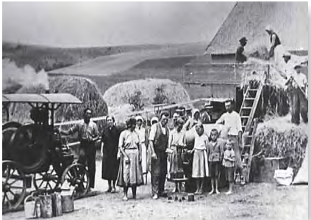
Cséplés az 1940-es években

Az értékek közérdeklődésre tartanak számot, hasznos munka van bennük, egyediek, fenntartandóak. A javaslattevő a benyújtani kívánt értéket az újság mellékleteként becsatolt adatlapon adhatja be Pétervására Város polgármesteréhez. Az Értéktár Bizottság a beérkezett javaslatokat megvizsgálja, kategorizálja és javasolhatja az egyes értékeknek a Megyei, illetve a Magyar Értéktárba vételét, azt követően Hungarikummá nyilvánítását.