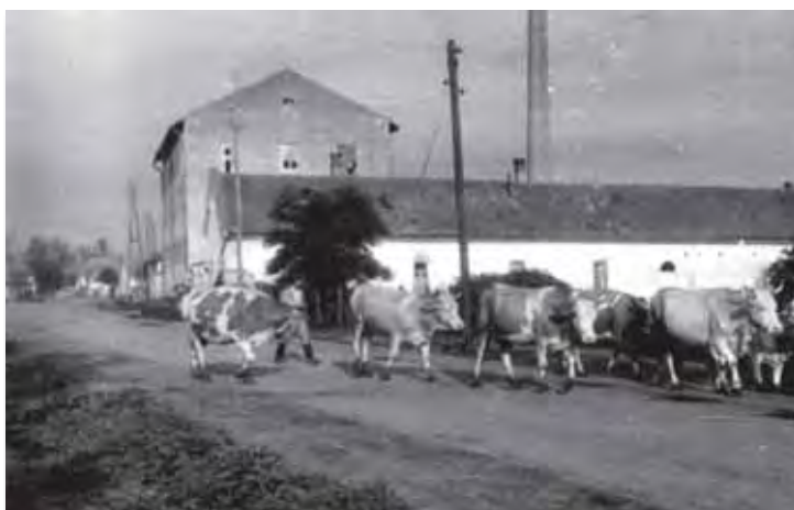
A Petőfi út az 1960-as években